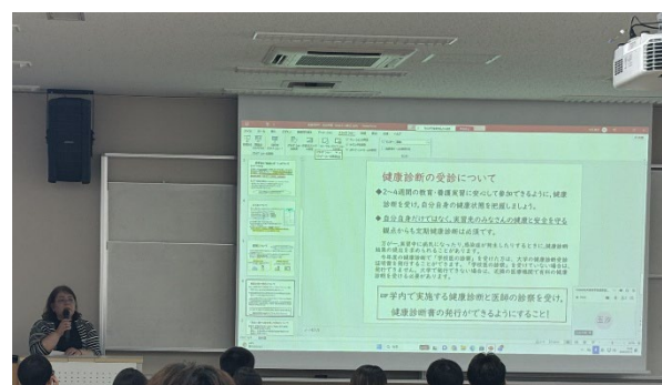
神田副センター長より心構えと諸注意