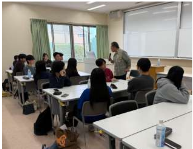
写真2 講話を釘付けになって聞いている生徒