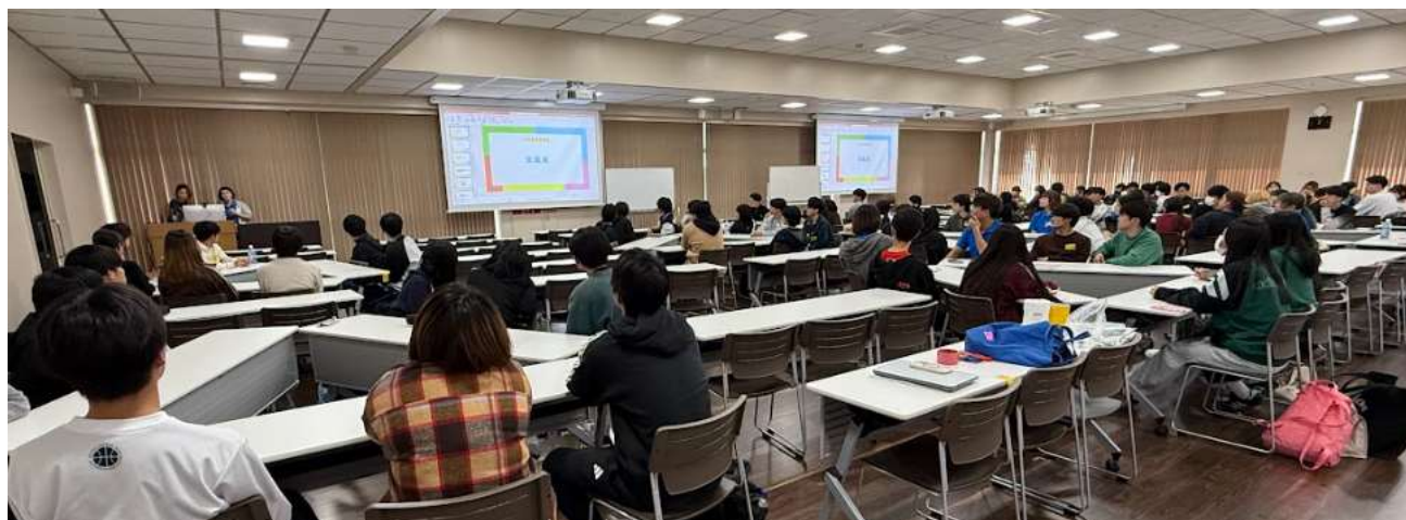
写真1・2 交流会の様子 2月12日(木)

さらに交流を通じて具体的な情報を得られ、入学前の不安が解消されたという成果があったようです。