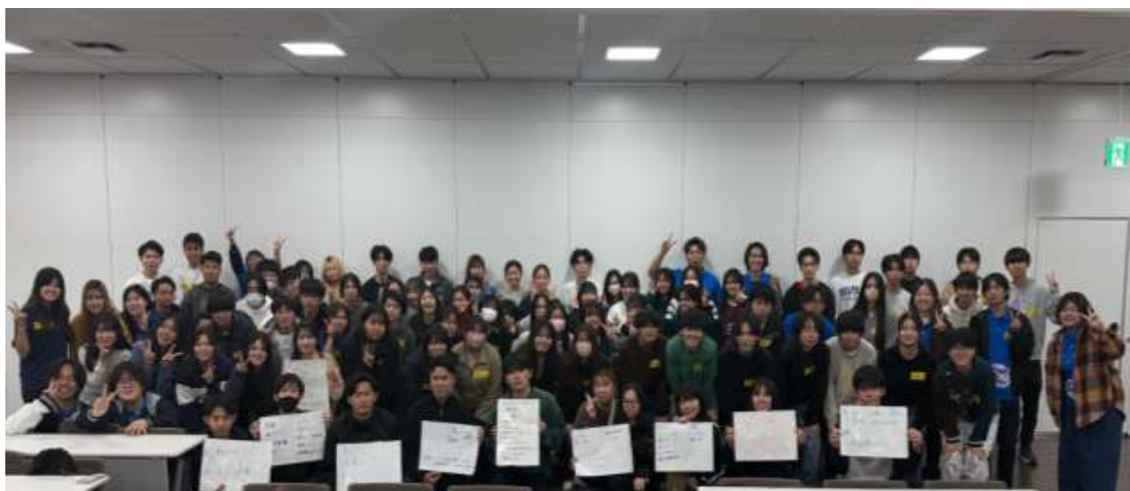
写真5 交流会後の高校生と先輩学生の集合写真