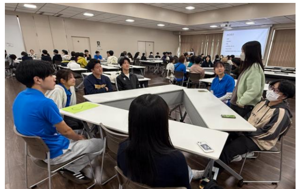
写真 4 交流会の様子 2 月 13 日（火）