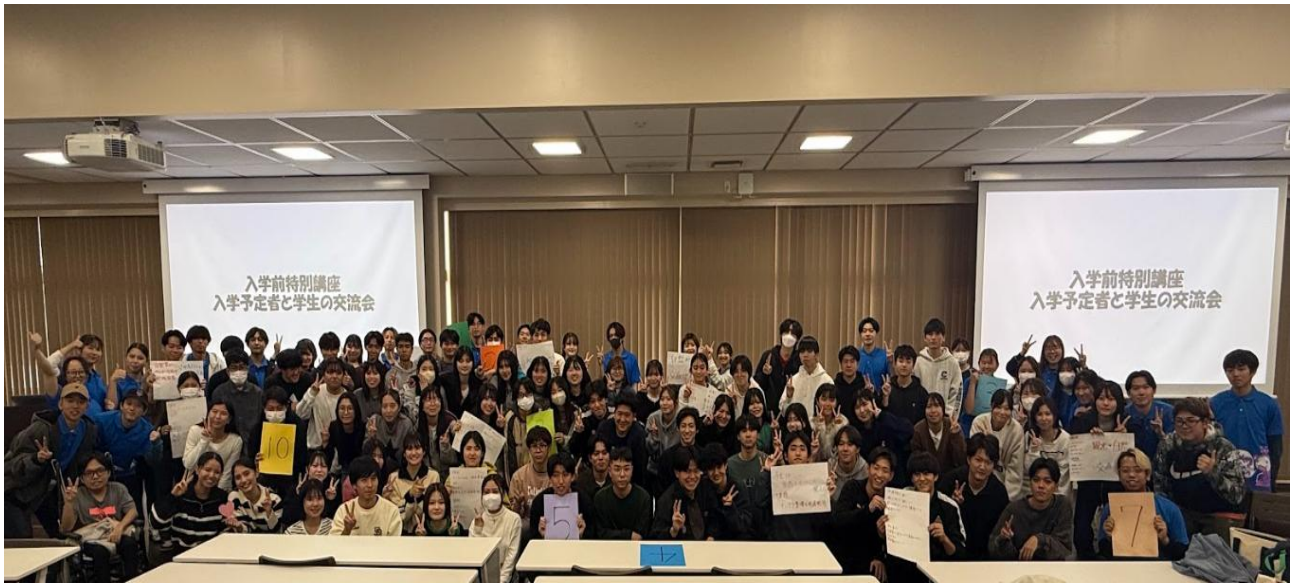
写真5 交流会後の講座参加者の集合写真 2月13日(火)