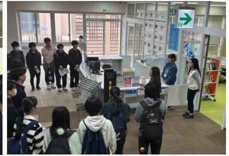
写真 3 ライティングセンター紹介の様子

入学前特別講座は、先輩学生や 3 学習センターのチューターの応援があり、高校生同士、または先輩のチューターとの学び合いの成果が本講座の成果に結びついていることは生徒のコメントからも明らかです。さらに、入学後は本学の特色ある取組の学習センターを積極的に利用し、半年または 1 年後には、学習センターのチューターにもなって欲しいと思っています。