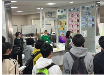
写真 2 数理学習センター