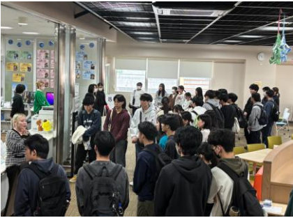
写真 1 言語学習センター