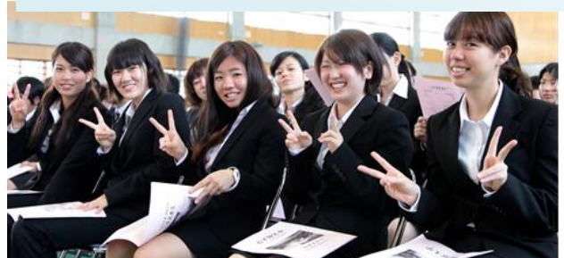
入学式。スーツ姿で大学生活がスタートしました!